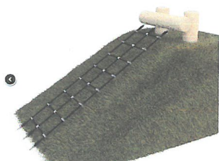
Tor przeszkód +/- 5000zł